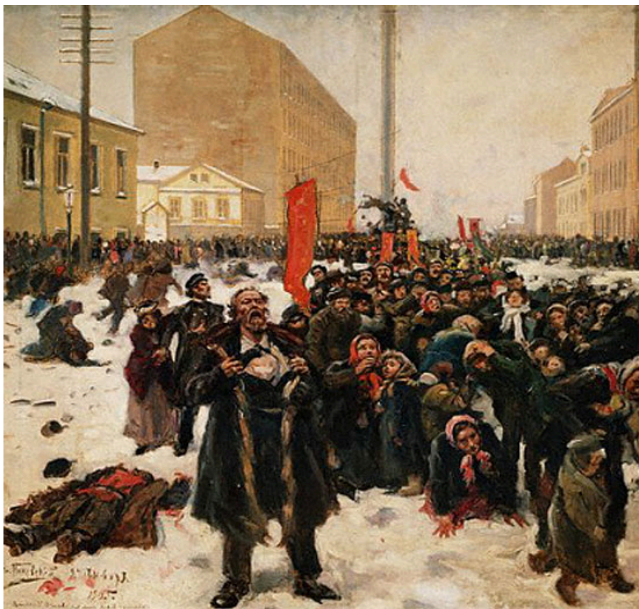
К. Маковский. «9 января 1905 года на Васильевском острове»